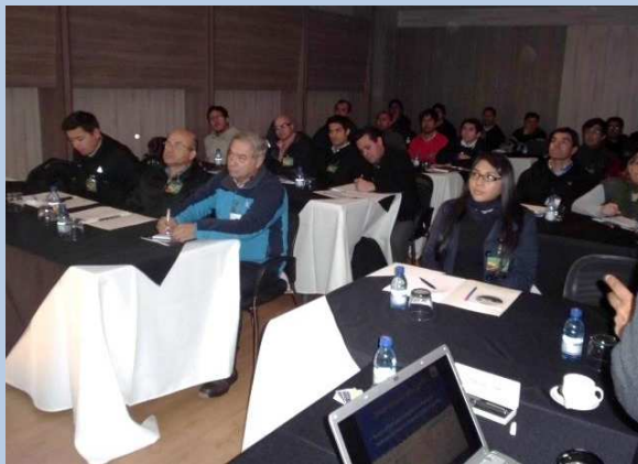
Sesión de Trabajo