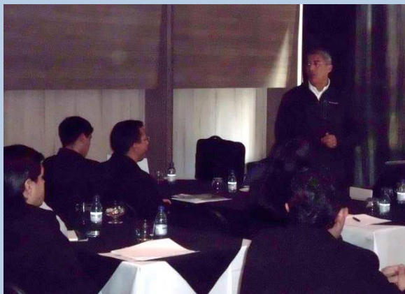
Sesión de Trabajo