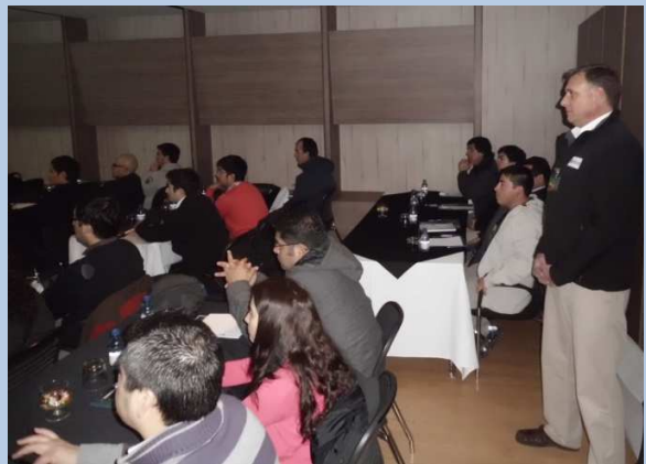
Sesión de Trabajo