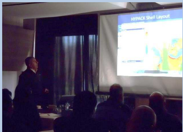
Sesión de Trabajo