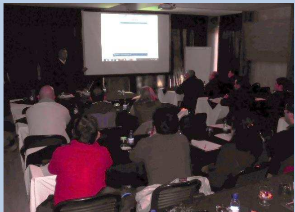
Sesión de Trabajo